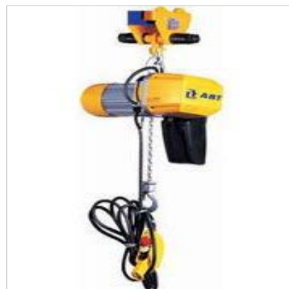
Hejse-, løfte- og transportredskaber er f.eks. kraner, taljer, spil, gaffeltruck, stabletruck, løftevogne, personløftere, transportører, rullebaner